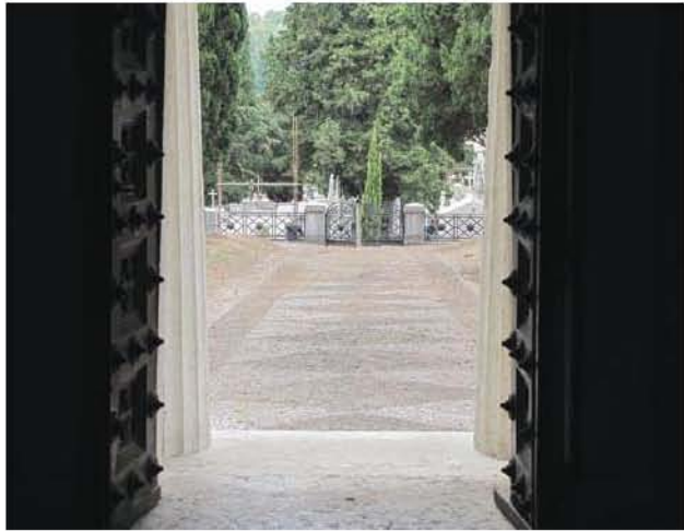
Fig. 4 – Vista do recinto do jazigo Palmela, a partir do interior do respectivo mausoléu.

semicírculo. Estes janelões são vedados por grades de ferro com balaústres radiados, servindo como principal foco de iluminação para o interior do jazigo, embora existam também pequenos postigos ao nível do chão, que iluminam as escadas de acesso à cripta da pirâmide. Apenas na face posterior do mausoléu, este janelão é cego.