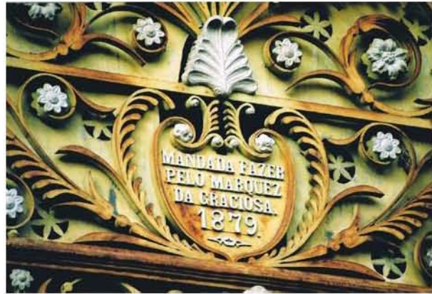
Fig. 11 – Cemitério de Anadia, detalhe do portão do jazigo-capela dos Marqueses da Graciosa.

São dois os elementos exteriores que mais se destacam nesta capela, sendo claramente regionais. O primeiro é o portão, onde se lê que a capela foi mandada erigir pelo Marquês da Graciosa em 1879. Trata-se de um trabalho excepcional de ferro forjado, com pequenos elementos fundidos aplicados (flores), ao estilo da serralharia de Coimbra desta época. Porém, como complemento ao portão existe, pelo interior, uma chapa de ferro recortada em função do portão. Assim, no corpo dos batentes, esta chapa forma o recorte de uma grande cruz, colocada ao centro do portão. Na bandeira, a chapa é recortada em forma de rosetas, as quais reforçam ainda mais o efeito dos elementos vegetalistas nos varões em ferro. Apesar de não ser uma obra erudita, é um portão de extremo bom gosto e efeito estético notável, mesmo se excessivamente decorado para o tipo de fachada. A adição de chapa recortada a um portão é claramente uma solução local, repetindo-se em versão mais simples noutras capelas deste cemitério.