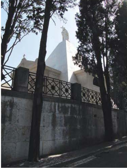
Fig. 3 – Mausoléu Palmela, podendo observar-se a diferença de cota entre o espaço do jazigo familiar e o restante cemitério.