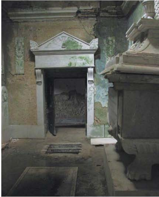
Fig. 6 – Interior da capela tumular da família Quintela do Farrobo no Convento de Santo António da Castanheira.