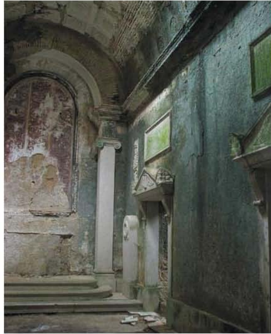
Fig. 7 – Outro aspecto do interior da capela tumular da família Quintela do Farrobo no Convento de Santo António da Castanheira, vendo-se o que resta do altar, e o acesso à sacristia.

Seja como for, uma impressionante e cenográfica capela tumular foi mesmo construída no Convento de Santo António da Castanheira, e a trasladação dos restos mortais, dos pais e de um filho do 1.º Conde do Farrobo, concretizada em Outubro de 1845. O cortejo foi todo planeado para ser impressionante e grave 4 .