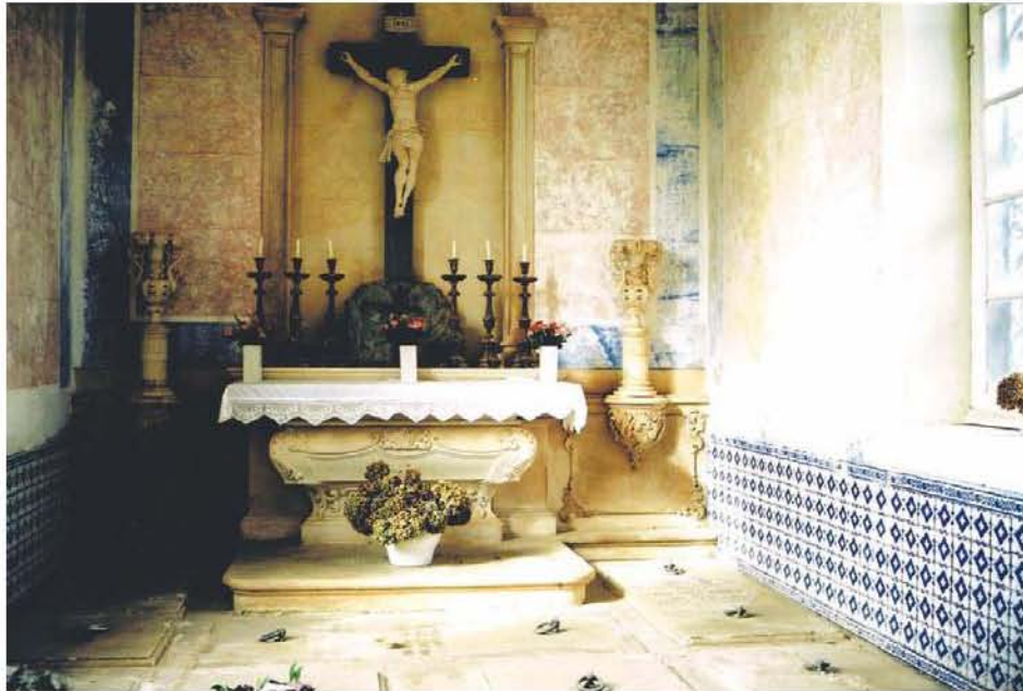
Fig. 12 – Cemitério de Anadia, interior do jazigo-capela dos Marqueses da Graciosa.

O interior desta capela possui ainda outros aspectos decorativos de grande interesse. Assim, existe azulejo relevado, azul e branco, nas paredes laterais, bem como marmoreados pintados. A cabeceira é neoclássica, mas certas partes do altar denotam um gosto revivalista pelo rococó, nomeadamente o arco do nicho e duas mísulas rocaille onde foram colocados vasos, de ornato bastante elaborado. No nicho, existe um Cristo crucificado em pedra mármore, assente num calvário. Trata-se de um interior de capela sepulcral requintado, denotando uma vontade de ostentar pompa e, sobretudo, realçar os pergaminhos de nobreza da família, ao ser a capela concebida quase como se tivesse sido erigida numa velha quinta. É certo que o interior desta capela não é erudito, pois os azulejos relevados (apropriados a fachadas urbanas) e a simplicidade dos marmoreados lembram um gosto mais comum em burgueses endinheirados, e em brasileiros de torna-viagem. Porém, existem detalhes construtivos de boa qualidade, resultando num contraste singular. Trata-se, pois, de uma capela incontornável na nossa tumulária romântica.