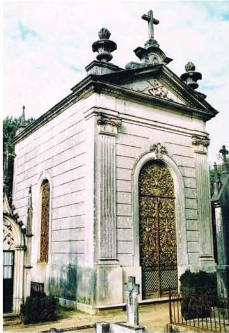
Fig. 10 – Cemitério de Anadia, fachada principal do jazigo-capela dos Marqueses da Graciosa.