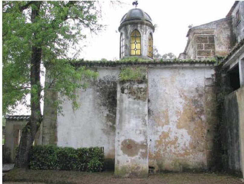
Fig. 5 – Capela tumular da família Quintela do Farrobo, no Convento de Santo António da Castanheira.

pedira para ser sepultado na capela-mor da Igreja do Convento das Religiosas da Visitação (vulgarmente conhecido como Convento das Salésias), do qual tinha o padroado. Contudo, quando o Convento de Santo António da Castanheira foi comprado pelo filho, Joaquim Pedro Quintela do Farrobo (1.º Conde do Farrobo), a construção da actual igreja do Convento das Salésias estava a iniciar-se. Joaquim Pedro Quintela do Farrobo pode ter considerado que a primitiva igreja das Salésias, incorporada na Fazenda Nacional, deixaria depois de ter o fim a que fora destinada e, portanto, era melhor opção constituir capela tumular privativa num convento que pertencesse integralmente à família, o qual, ainda por cima, ficava junto à Quinta do Farrobo, local de origem de um dos principais ramos da família e que dava nome ao vínculo. Aliás, o próprio Joaquim Pedro Quintela, certamente antes de instituir jazigo privativo na primitiva igreja das Salésias, havia proposto à Câmara de Vila Franca de Xira a reedificação, à sua custa, da Ermida de S. Sebastião, arruinada com o terramoto de 1755, com a condição de a capela-mor passar a ser seu jazigo privativo, o que não foi aceite, tendo esta capela sido posteriormente demolida 3 .