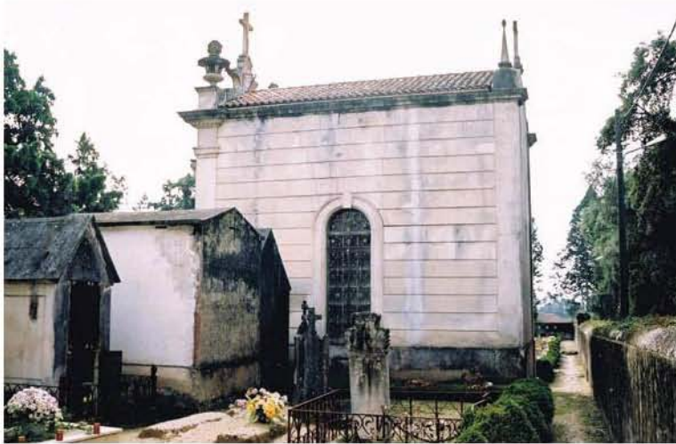
Fig. 9 – Cemitério de Anadia, jazigo-capela dos Marquesses da Graciosa.