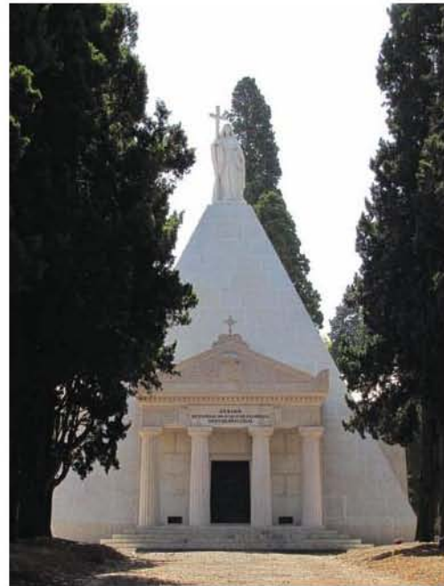
Fig. 2 – Jazigo da família Palmela, com o mausoléu ao fundo.

Nota-se que o projecto visava a criação de um espaço tumular autónomo face ao cemitério, ainda que claramente identificado, para que, quem passasse por ali, percebesse de imediato do que se tratava e a quem pertencia. A relação entre espaço interior e espaço exterior, dentro do próprio recinto do jazigo privativo, assim como a hierarquização dos espaços, fora e dentro do mausoléu que pontua no topo do recinto do jazigo, vamos encontrá-las também em quintas solarengas de períodos anteriores. Os muitos metros que se percorrem, desde o portão de ingresso no jazigo até à entrada do mausoléu propriamente dito, também replicam, numa escala mais reduzida, o percurso desde o portão de um qualquer cemitério até à capela mortuária. Trata-se de uma pequena alameda calcetada, ladeada por renques de ciprestes, por entre os quais encontramos sepultados alguns dos criados da Casa Palmela: de um lado, os do sexo feminino e, do lado oposto, os do sexo masculino, numa opção cenográfica de grande significado. Estamos perante uma transposição, para o espaço funerário, da própria estruturação formal da Casa Palmela, como espaço de sociabilidade.