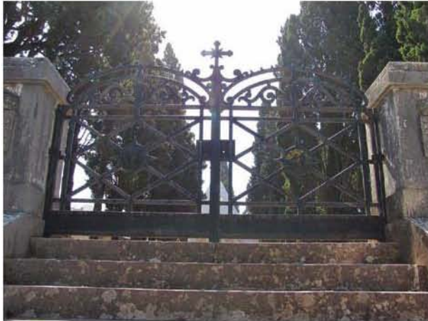
Fig. 1 – Portão de entrada no jazigo da família Palmela.